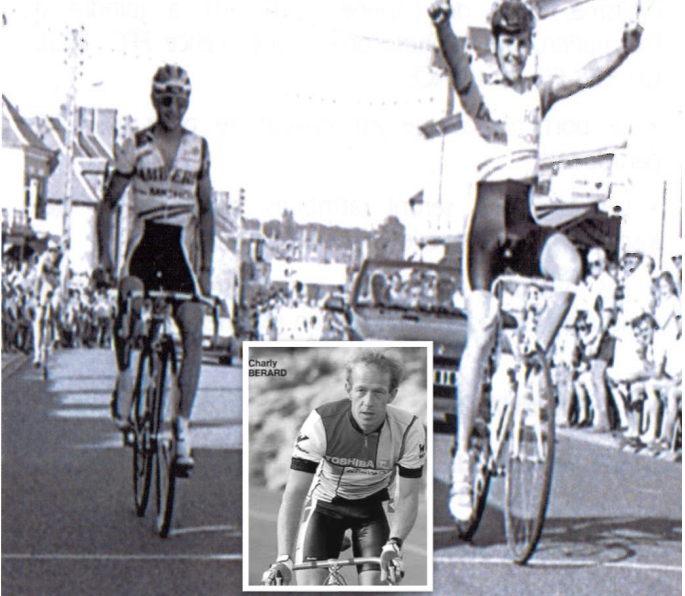
Trophée de Bourgogne des Cyclosporitives FFC